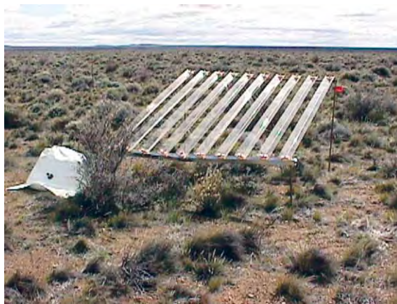
Figura 4: Interceptores de lluvia diseñados para simular sequía de intensidad variable en un experimento a campo en la estepa Patagónica, Sudoeste de Chubut, Argentina. Los modelos contenían 6, 10 o 14 bandas de acrílico y fueron diseñados para interceptar el 30, 55 u 80% de la precipitación, que era colectada en un tanque flexible ubicado al lado de la parcela experimental. Se muestra un modelo con 10 bandas de acrílico, diseñado para interceptar el 55% de la precipitación y simular una sequía de mediana intensidad.

En experimentos a campo, la simulación de sequía puede involucrar la exclusión de lluvia a través de interceptores móviles que sólo funcionan en los períodos de lluvias o techos fijos que reducen la cantidad de agua que llega al suelo (Figura 4). La combinación de interceptores fijos con sistemas de riego que controlan el agua caída permite la simulación de cambios de clima. Estos experimentos manipulativos ayudan a comprender las consecuencias ecológicas del cambio climático. Por ejemplo,