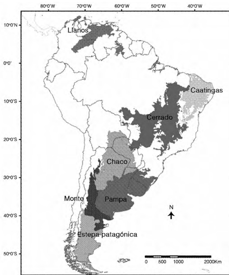
Figura 1: Distribución de las regiones de pastizales, montes y sabanas que se usan para pastoreo extensivo, es decir la forma tradicional de producción animal, en Sudamérica. Se muestran las distintas regiones de Sudamérica ocupadas por ecosistemas de climas áridos hasta subhúmedos en las que el pastoreo es una de las principales actividades productivas. Reproducido con permiso de Yahdjian y Sala (2008).

mayor productividad, con precipitaciones anuales cercanas a 1500mm.